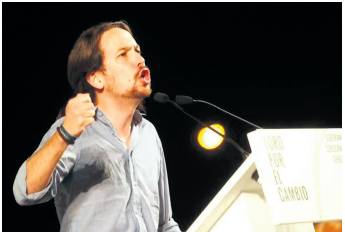
Iglesias contra Ahora en Común: “No tenemos la obligación moral de salvar a la izquierda”

La dirección de Podemos no quiere una candidatura de unidad popular y tiene como gran