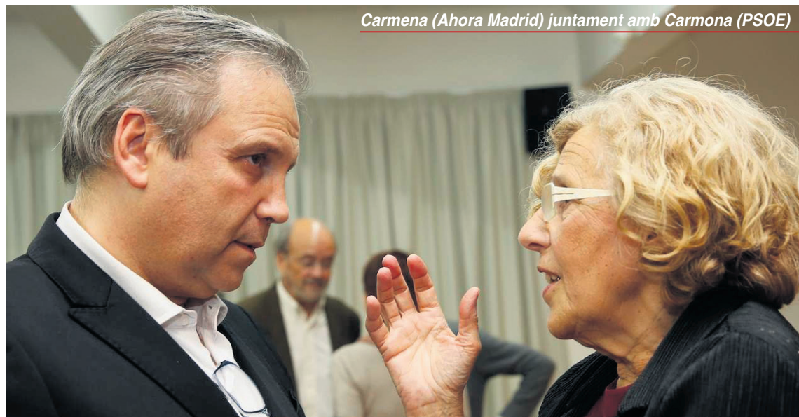
Carmena (Ahora Madrid) juntament amb Carmona (PSOE)

PAH-Vallekas: "No és presentable que la Carmena s'hagi reunit ja amb els responsables dels desnonaments, és a dir, gestors de Bankia, i no amb la PAH."