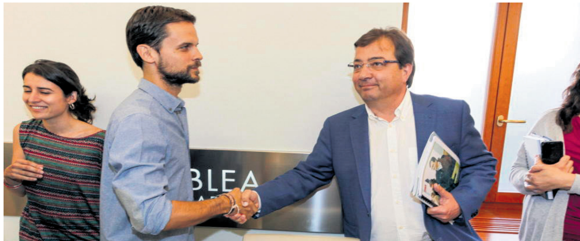
Extremadura: los dirigentes de Podemos y del PSOE se dan la mano

No sólo ha sido su apoyo a las investiduras, sino el aval político que Podemos ha dado a un PSOE desacreditado que ha perdido nada menos que 750.000 votos