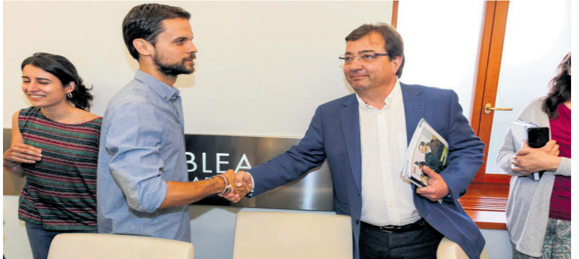
Extremadura: els dirigents de Podem i del PSOE es donen la mà.

Però, Podem no ha estat gens conseqüent amb aquests plantejaments. Per contra, ha canviat escandalosament de criteri. El candidat de Podem a la presidència d'Extremadura és un bon exemple. El 24 de maig, en campanya electoral, deia: "el PSOE és