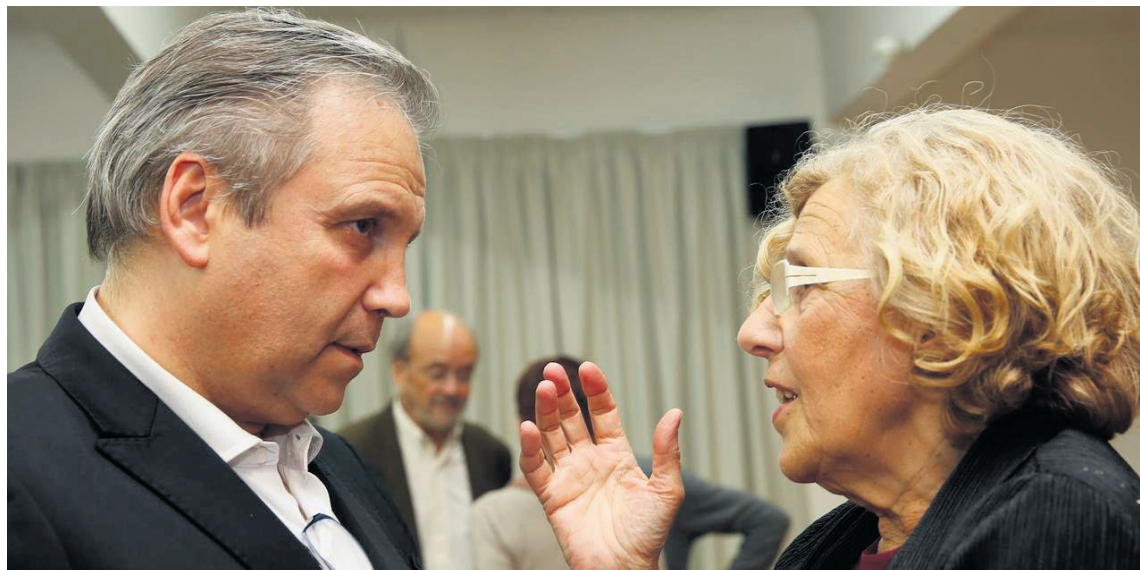
Carmena (Ahora Madrid) junto con Carmona (PSOE)

PAH-Vallekas: "No es de recibo que Carmena se haya reunido ya con los responsables de los desahucios, léase gestores de Bankia, y no con la PAH."