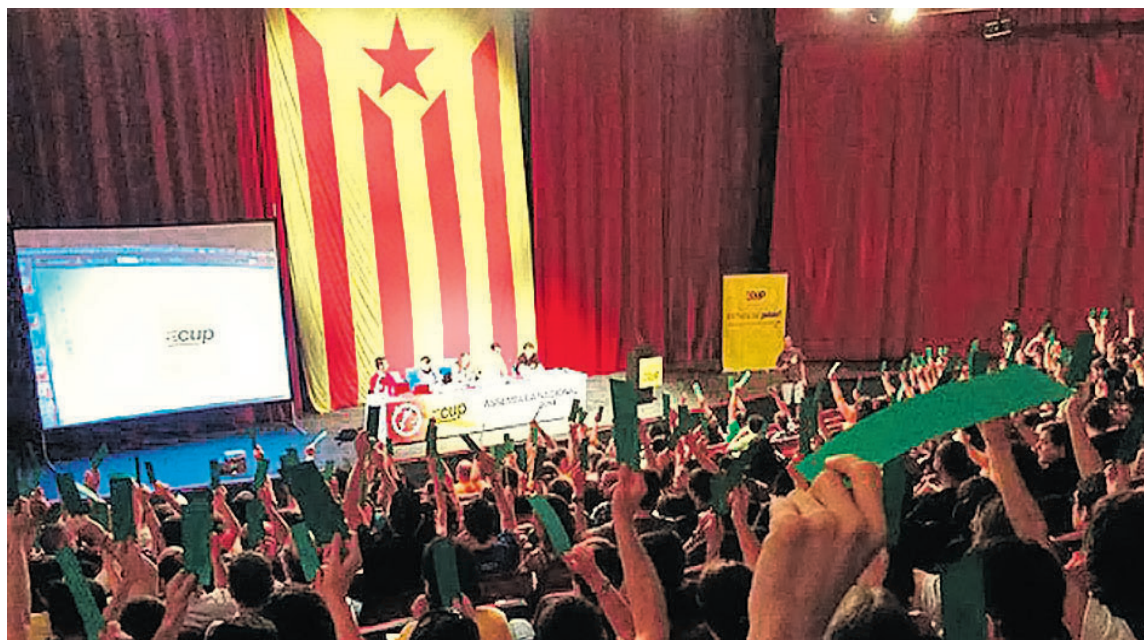
Asamblea de la CUP

No sabemos qué pasará al final, puesto que incluso la propia convocatoria del 27-S está en el aire, según ha amenazado el presidente Mas. En cualquier caso, la CUP-Crida Constituent tiene que rechazar con claridad la propuesta de lista civil y afirmar la candidatura propia. Hay mucho en juego.