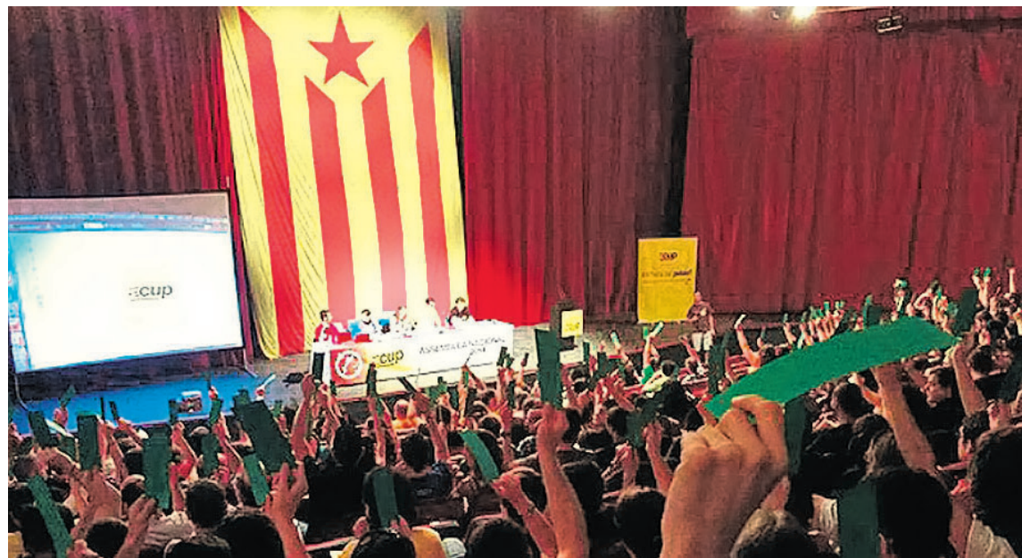
Assemblea de la CUP

I no està escrit enlloc que calgui una llista civil única per comptar vots. És suficient comptar els vots de les candidatures per la independència. Algú dubta que els vots d'una llista CUP-Crida Constituent són vots per la República catalana, per a la independència?