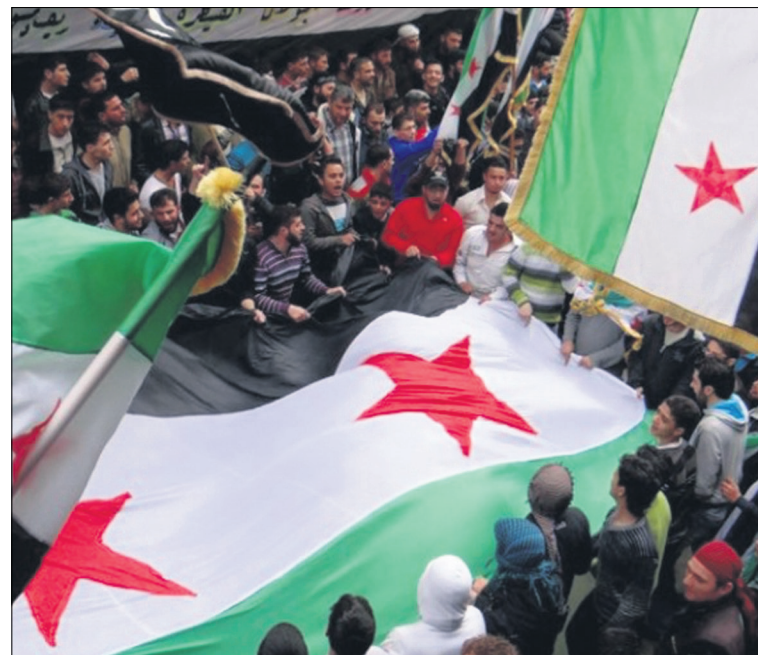
Manifestación en Aleppo, segundo aniversario de la Revolución siria

La lista de participantes en Viena expresa perfectamente bien la actual situación en el país árabe. Ningún grupo sirio, sea la Coalición Nacional Siria (el principal grupo de la oposición exiliada) o los grupos rebeldes que actúan