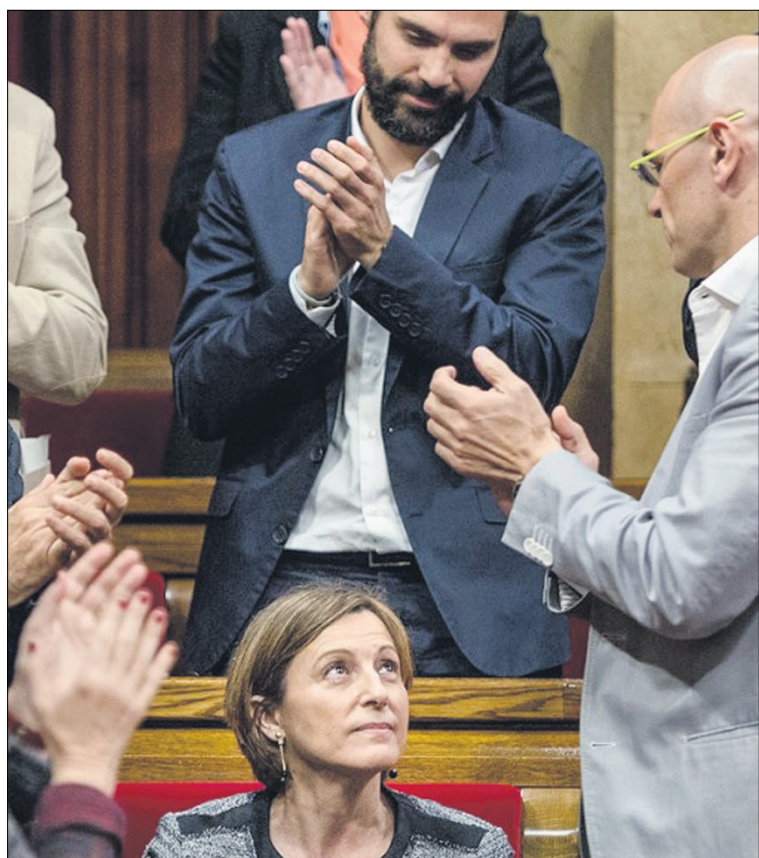
Rosa Canyadell (JxS), es elegida presidenta del Parlament

Si es cierto que no queremos escoger entre independencia y justicia social, entonces, hay que ser coherentes con el programa, con los votantes, con la gente luchadora y comprometida que ha visto en la CUP-CC una fuerza rupturista por la soberanía de Cataluña, contra la Europa de la Troika y por el cambio social.