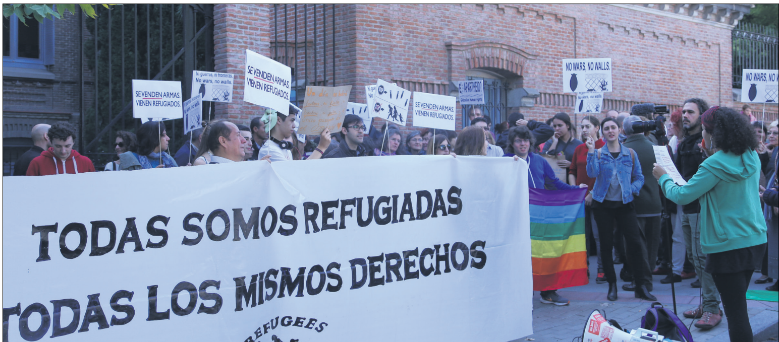
Concentración en apoyo a los refugiados en Madrid

Ante el fracaso de la UE en manejar el asunto están surgiendo de manera espontánea en distintos países movimientos independientes de acogida y solidaridad con los inmigrantes. Movimientos como la Red Solidaria de Acogida de Madrid, que se viene reuniendo desde el inicio de la crisis de los refugiados con el objetivo de organizar iniciativas de solidaridad, como la acogida en las estaciones de autobús, los servicios de traducción y el