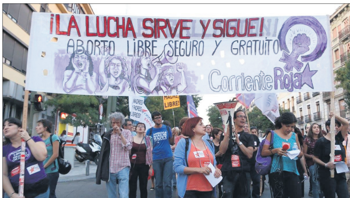
Corriente Roja en la manifestación por la despenalización del aborto, Madrid, 28/09/15

El machismo es una ideología que a la burguesía le interesa mantener y reproducir porque es una de las herramientas que utiliza para la sobreexplotación de las mujeres trabajadoras, así como para debilitar y dividir al conjunto de la clase. Esto se potencia sobre todo en tiempos de crisis. Por eso