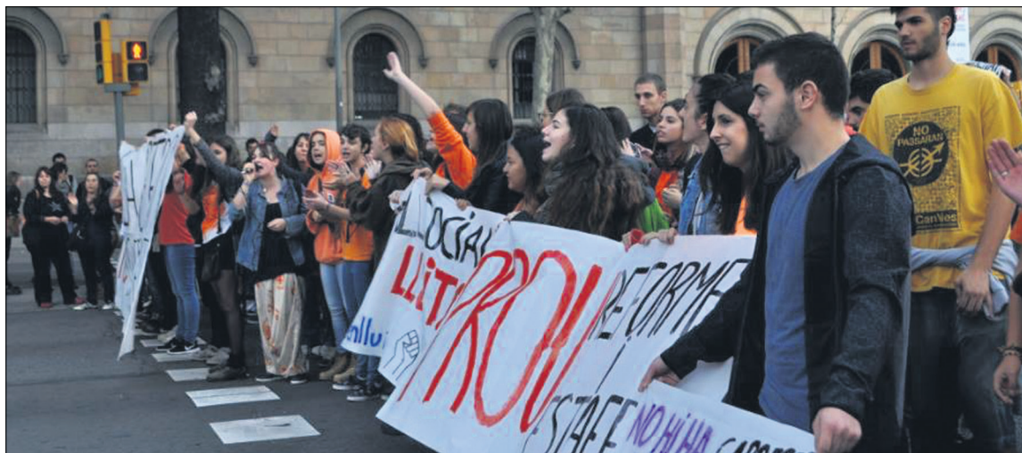
Manifestació de Treball Social davant del Rectorat de la Universitat de Barcelona

E: Vam creure molt oportú construir, primer de tot, un moviment de base des de la nostra facultat, la Facultat d'Educació. Així, vam començar a fer assemblea quasi cada dia, penjant cartells