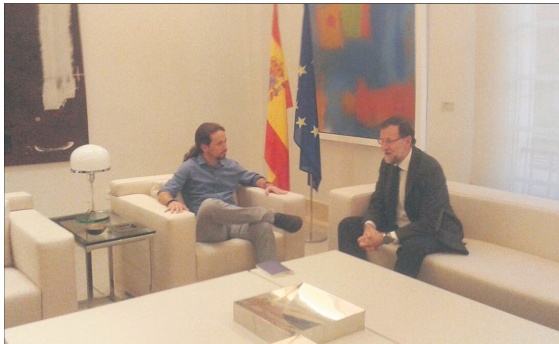
Rajoy cridà a converses a diferents representants de partits polítics, entre d'ells Pablo Iglesias de Podem

D'aquestes condicions es dedueix que no podem donar suport a la investidura de Mas ni de JxS. Diuen que això suposaria fer "descarrilar el procés". Però qui ho faria descarrilar és qui es nega a un pla de xoc digne de tal nom, a prendre mesures de desobediència bàsiques o a resistir l'embat de l'Estat.