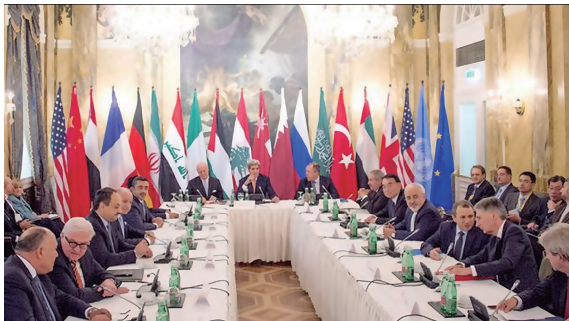
Cumbre de Viena, Rusia, EE.UU. y la UE, junto con sus aliados en la región, deciden el futuro de Siria

Este es el verdadero miedo de los políticos y las empresas multinacionales que actúan en la zona. Que sus beneficios se vean amenazados por las masas árabes a las que solo les queda la alternativa de salir a la calle a protestar. Una revolución social victoriosa en la región puede empezar a cuestionar la dominación económica y política de las distintas potencias mundiales en la zona. A esta dominación económica y política parasitaria, existente en todo el mundo, le llamamos imperialismo y es a este sistema podrido al que debemos derrotar de manera unificada a nivel global.