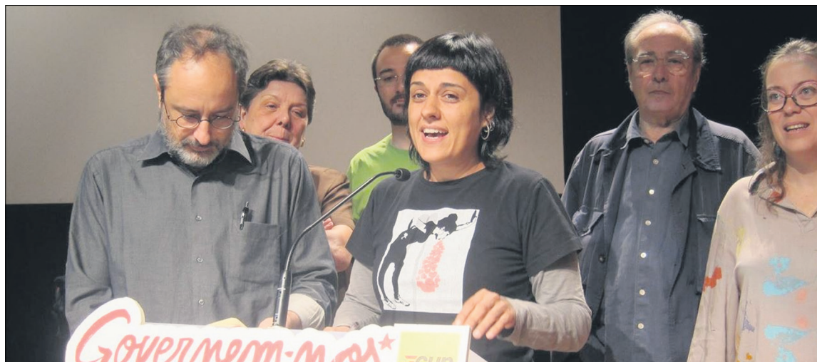
Los ahora diputados de la CUP-CC, foto hecha durante la campaña electoral

A pesar de ello, el Gobierno ya lo ha dispuesto todo para recurrir la declaración y las sucesivas decisiones de las instituciones catalanas, inhabilitar a sus responsables, multarlos y llevarlos a prisión. Están preparados para suspender la autonomía y someter a la Generalitat a las órdenes directas de Madrid, incluidos los Mossos d'Es-