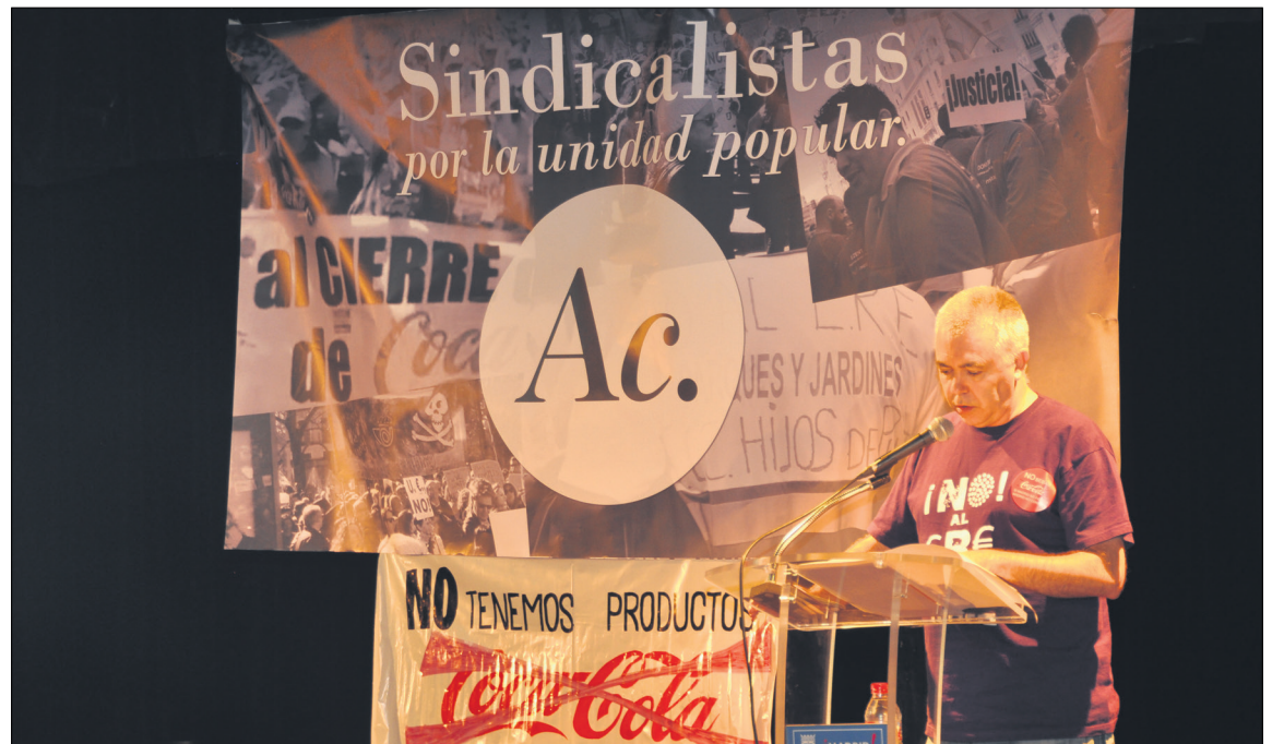
Acto de “Sindicalistas por la Unidad Popular”

El programa no es un conjunto de “sugerencias”, sino un contrato social, que nos compromete a luchar por él. (...)”