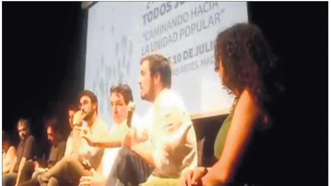
Alberto Garzón, elegido cabeza de lista de Ahora en Común

Coincidimos además con varias de las medidas anunciadas porque algunas son las propuestas centrales presentadas por Sindicalistas por la Unidad Popular. Medidas como la derogación de las reformas laborales, un salario mínimo interprofesional superior a los 1.000 euros; la nacionalización de la banca, de industrias claves como las eléctricas; la subida de los impuestos a las grandes fortunas, bancos, Iglesia; la defensa de la sanidad y la educación pública sacando la religión de las aulas, acabando con la educación concertada y el concordato con la Iglesia; la defensa de la república frente a la monarquía, la defensa del dere-