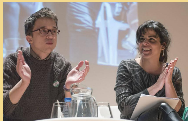
Iñigo Errejón y Teresa Rodríguez en un acto en Andalucía

La gran bandera de Anticapitalistas para diferenciarse de Iglesias son "las lecciones de Grecia" y la "estrategia desobediente" frente a la UE. Llevan razón cuando dicen que "una estrategia que busca la negociación y, en último término, el acomodo en los tratados europeos, es una vía que nos conduciría (también a Podemos) al sometimiento y el chantaje permanente". Del mismo modo, parece coherente defender que no hay que "acatar los límites al déficit público, ni los proyectos de control de la UE de las reformas fiscales y negociación