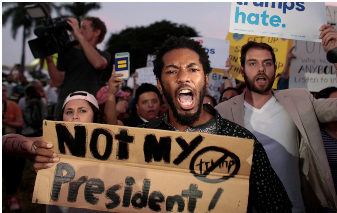
Protesta contra Trump en Miami, EEUU (Noviembre 2016)

Otro elemento fue el desgaste sufrido por el partido demócrata, que perdió 3 millones de votos con relación a la elección