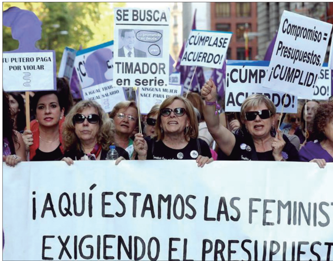
El acuerdo de gobierno responde a las movilizaciones de las mujeres con un apartado de “medidas feministas”.

Ninguna novedad respecto al decreto de marzo de 2019, que casi un año después no tiene desarrollo reglamentario y obliga a las empresas a llevar un libro de salarios y “avanzar” en la implantación de planes de igualdad, según un calendario que se extiende hasta 2021. El objetivo es lograr una mayor transparencia salarial, pero no hay medidas de fondo para acabar con todas las causas que