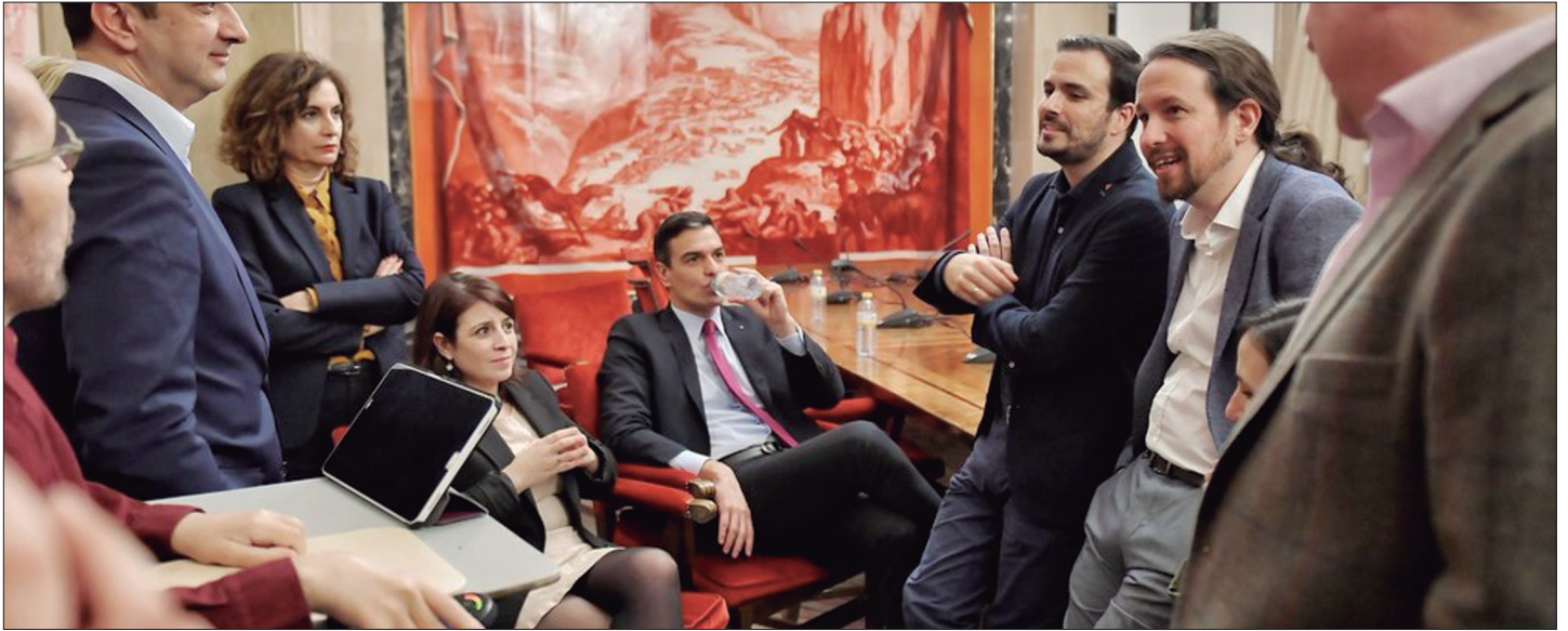
Los equipos del PSOE y Unidas Podemos, tras llegar al acuerdo de gobierno.