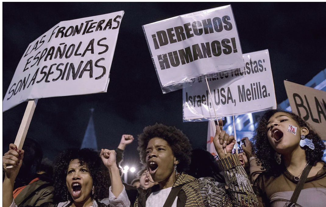
El racismo institucional continúa.

El año de legislatura de Pedro Sánchez tampoco ha sido un camino de rosas para las y los in-