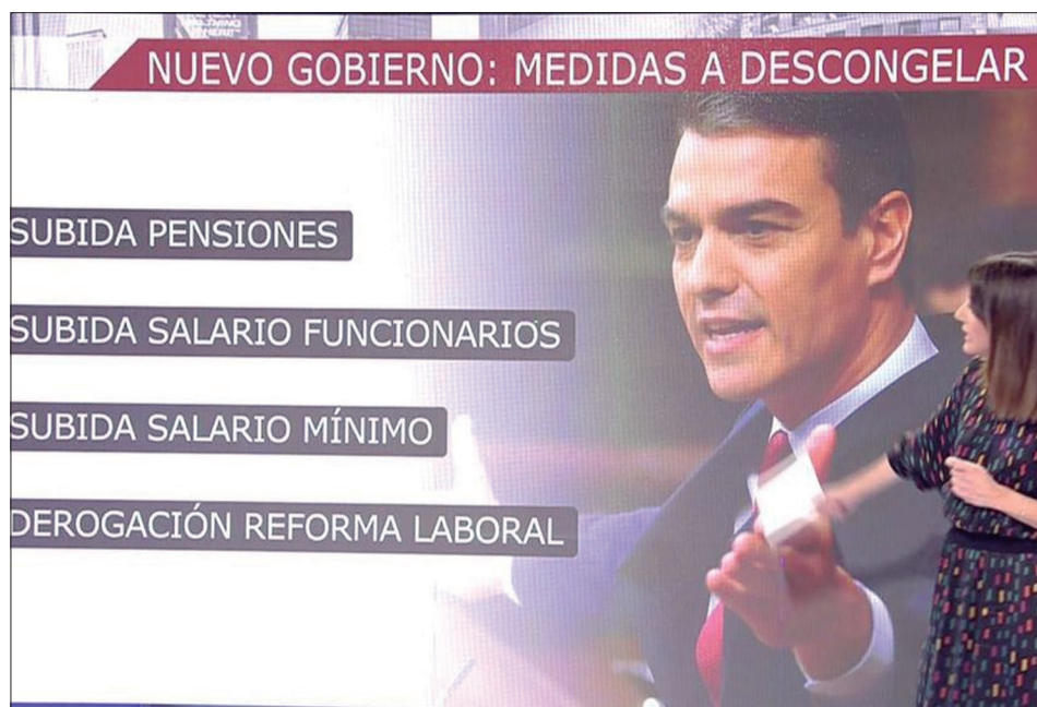
Amplia campaña en los medios sobre la derogación de la Reforma Laboral, que no es tal.

Por otra parte, que partidos que dicen llamarse progresistas hablen de “absentismo causado por bajas por enfermedad” es una lógica difícil de entender; el derecho a no ir a trabajar por enfermedad es una conquista histórica del movimiento obrero que no se debería asimilar nunca a “absentismo”.