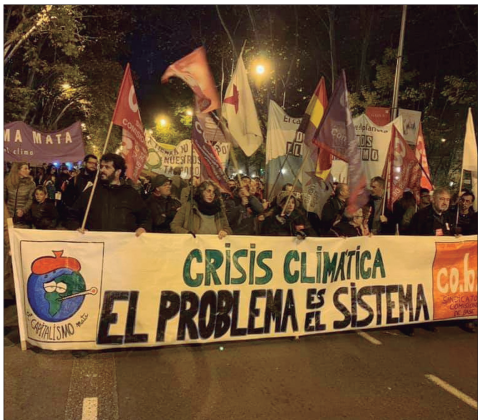
Necesitamos medidas reales ¡ya!

¡Este año continuemos con las movilizaciones de 2019! ¡Por medidas reales YA para parar la crisis ambiental!