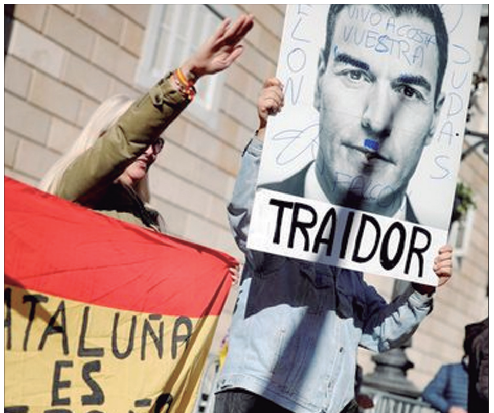
Primeras movilizaciones de la ultraderecha contra Pedro Sánchez

La posible falencia del nuevo gobierno nos debe encontrar levantando con claridad una alternativa independiente desde la izquierda, que permita que la gente trabajadora que quede desencantada no busque salida a su derecha, sino en posiciones revolucionarias.