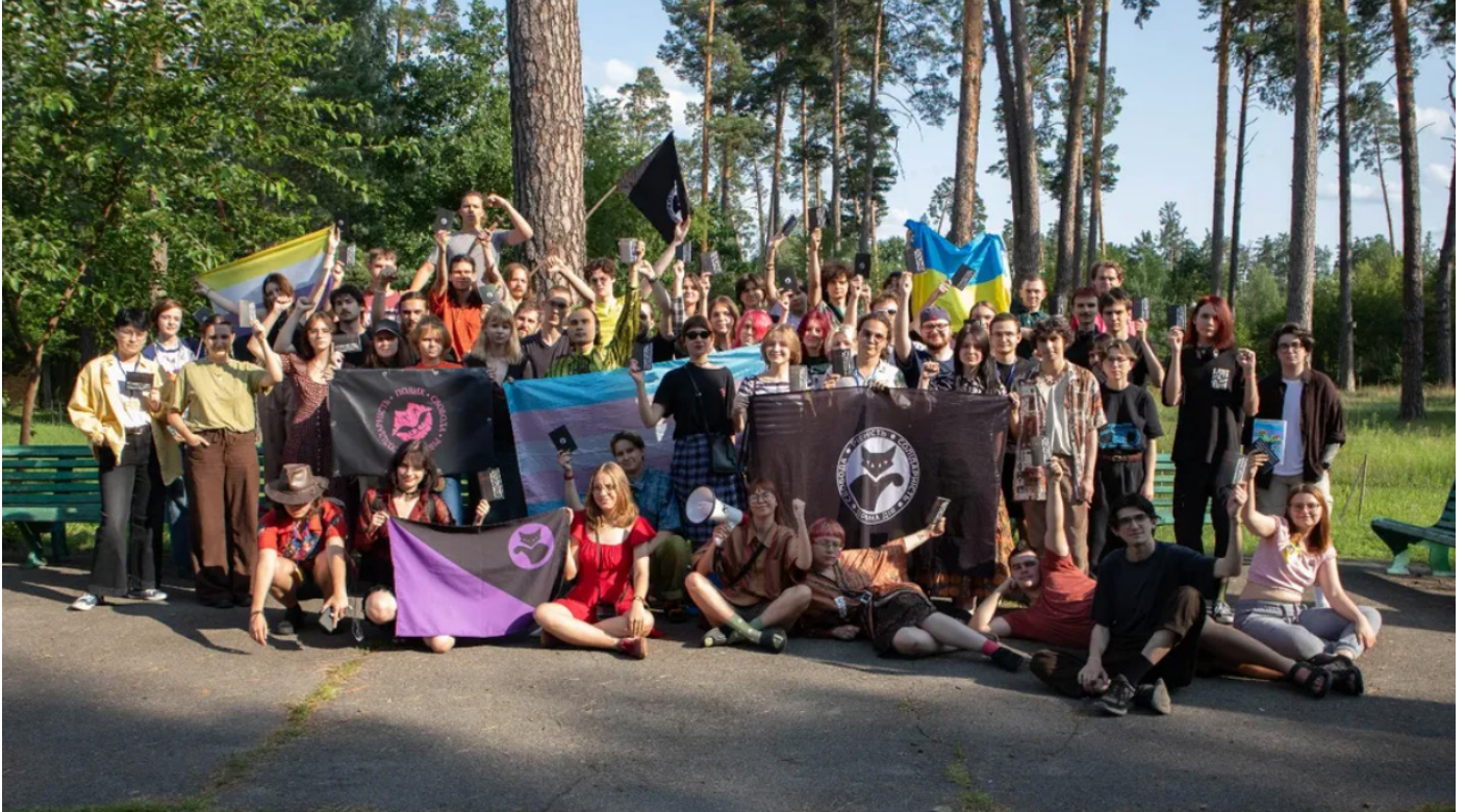
El sindicat Acció Directa en el seu IIIr Congreso, el passat mes d'agosto de 2025.

Priama Diia és un sindicat estudiantil ucraïnès d'esquerres que defensa els drets dels estudiants, l'educació lliure i lluita contra l'impacte de la guerra en l'educació universitària, participant en la resistència antiimperialista contra l'agressor rus. Reproduïm a continuació un article escrit per un dels seus joves estudiants.