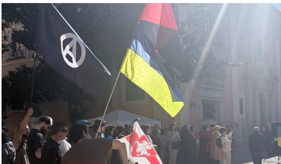
A dalt: Paradeta de la ASAU.