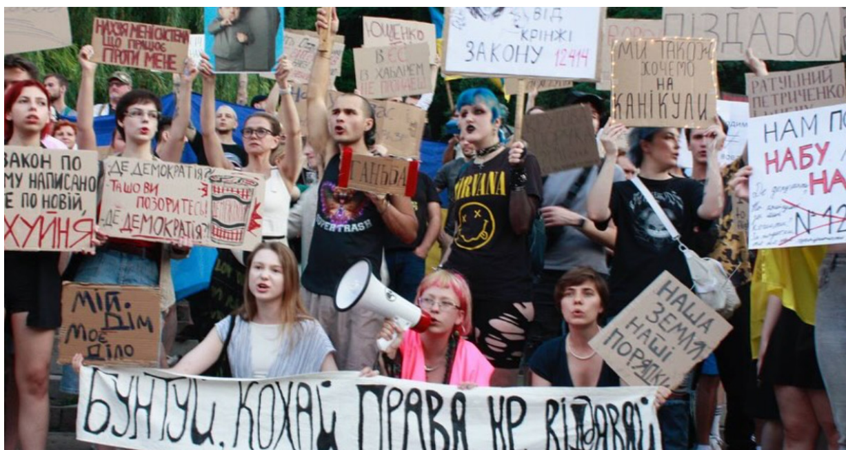
Després de l'aprovació de la llei n.º 4555, van esclatar a Ucraïna les majors protestes des de l'inici de la guerra a gran escala, amb la participació de desenes de milers de persones. Activistes d'Acció Directa es van unir a elles i van sortir a Kíev, Lviv, Dnipro, Úzhgorod, Nikolaiv i Odessa. Juntament amb altres activistes solidaris i ciutadans comuns que van enriquir la protesta amb els seus cartells, lemes incendiàries i imatges vibrants, van demostrar que, fins i tot durant la guerra, la societat no permetrà que els qui ostenten el poder prenguin decisions arbitràries per a tornar a omplir-se les butxaques amb impunitat. PODER PER A MILIONS, NO PER A MILIONARIS!

Quan es gasten fons en "prestigi", significa que s'invertiran milers d'hores de vida humana. Aquest temps específic no es va destinar a hospitals, energia ni seguretat. El treball sempre és limitat per naturalesa. La societat no disposa d'un temps de treball infinit. Per tant, cada elecció suposa el rebuig d'alguna cosa més. Les "autoritats" de Kíiv no trepitjaran els interessos de les grans empreses, els guanys de les quals depenen de festivals,