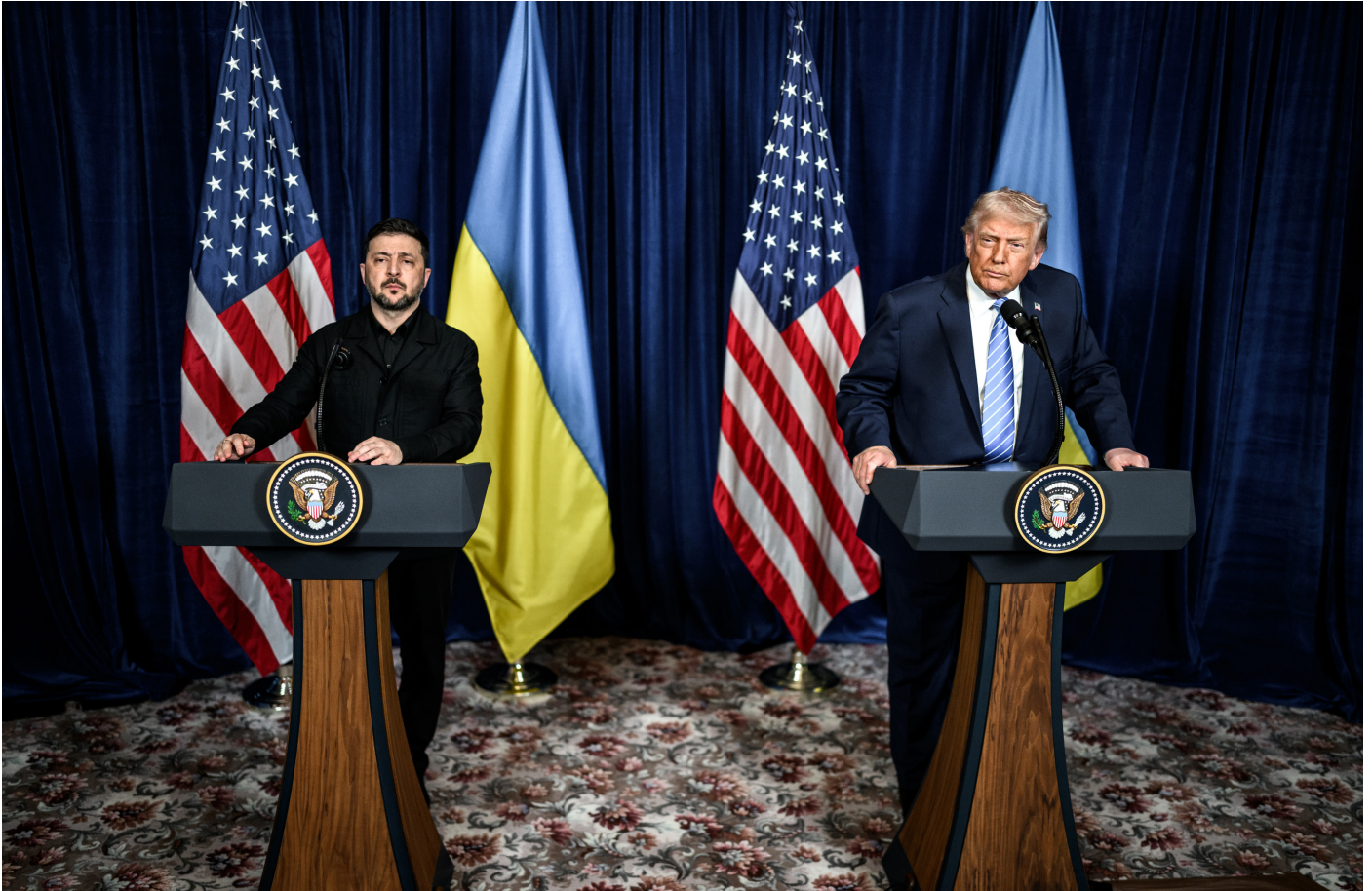
Donald Trump participa en una conferència de premsa conjunta juntament al president ucraïnès Volodymyr Zelensky a Mar-a-Lago a Palm Beach, Florida, el 28 de desembre de 2025.

La intervenció de potències imperialistes rivals en els conflictes i guerres dels països semicolonials és un fet des del sorgiment mateix de l'imperialisme i avui es presenta de forma accentuada. Ningú pot negar la intervenció indirecta dels EUA i de la UE, així com també de la Xina, en la guerra d'Ucraïna, així com el caràcter proimperialista i antiobrer del govern Zelensky.