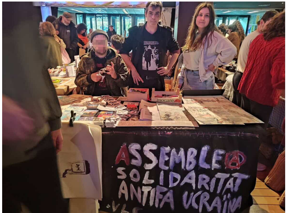
Assemblea de solidaritat antifeixista amb Ucraïna en una activitat en València.

Des d'anys abans de la invasió oberta, els aparells mediàtics del Kremlin –RT, Sputnik i una galàxia de comptes, canals i portals "alternatius"– han inundat Europa i el món amb narratives que es presenten com a "antiimperialistes", però que en realitat justifiquen l'expansió militar russa. S'associa la resistència ucraïnesa amb el "nazisme", es redueix la complexitat social d'Ucraïna a una marioneta de l'OTAN i s'intenta convèncer a sectors de l'esquerra que donar suport a la lluita popular a Ucraïna equival a alinear-se amb l'imperialisme occidental. Aquesta intoxicació ideològica, finançada amb recursos bilionaris i amplificada per