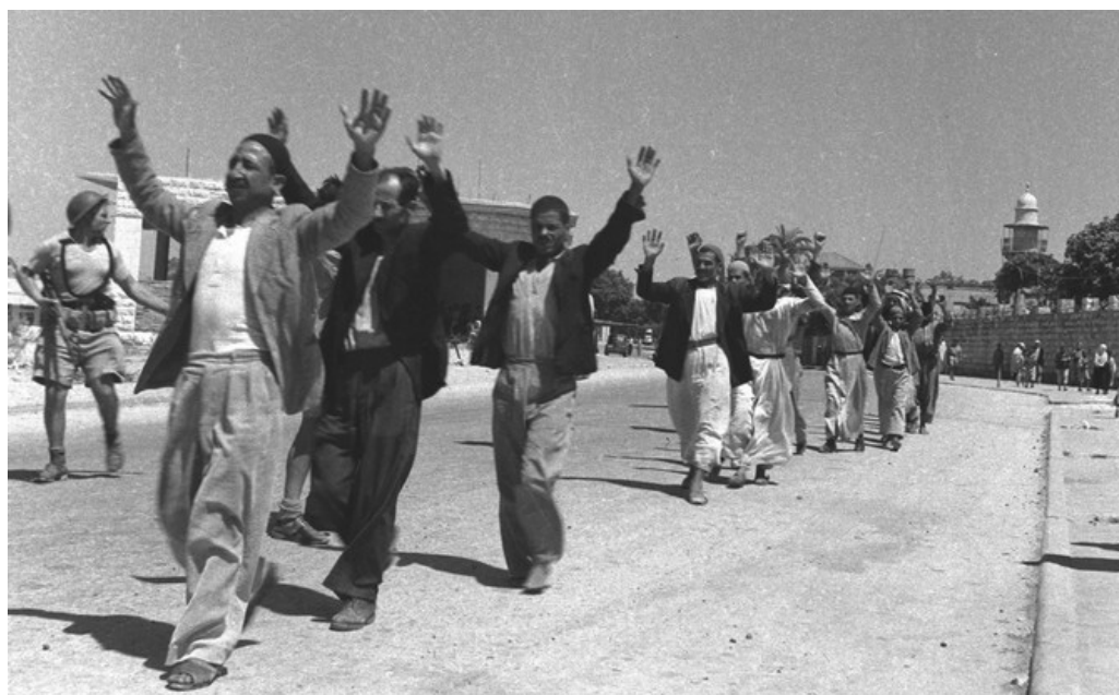
Palestins detinguts durant l'expulsió de Ramle, juliol de 1948

El pla de l'ONU va dividir Palestina en dues, lliurant el 56% als sionistes (que posseïen el 5% de la terra). No obstant això, ja el 1948, mitjançant la Nakba i la guerra amb els països veïns, Israel es va apropiat del 77% del territori. Des de llavors, l'expansió no ha cessat. Així van ser expulsats i dividits els palestins. Avui 2,3 milions malviuen (i moren) a Gaza, el major camp de concentració a l'aire lliure mai conegut; 3,5 milions viuen a Cisjordània, sotmesos al terror dels colons i l'exèrcit. Altres 2 milions viuen discriminats i sotmesos a l'Estat d'Israel (que compta amb 10 milions d'habitants), que només reconeix plens drets als reconeguts com a "jueus". Altres 6 milions de palestins viuen com a refugiats al Líban, Jordània, etc., sense possibilitat de retornar a la seva llar, on colons jueus arribats de tot el món s'han apropiat de les seves cases i