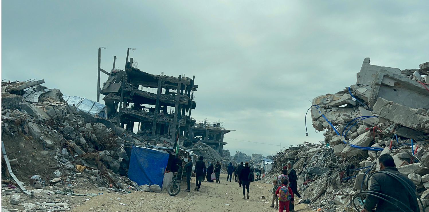
El carrer Al-Almeia a Jabalia, devastat per l'exèrcit israelià, després l'alto el foc signat al gener de 2025. 22 de febrer de 2025.

Però hi ha diversos problemes amb això. Israel va vetar la possible presència de tropes turques a Gaza i diversos països àrabs no tenen interès a ser simplement forces actuant a Gaza sota el comandament israelià, però sí que podrien interessar-se si hi hagués un pla per a eliminar tota la resistència palestina. Alguns defensen l'administració de l'Autoritat Palestina sobre Gaza, a més de Cisjordània, objectius amb els quals l'Estat d'Israel no està d'acord.