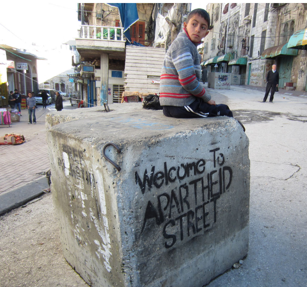
El carrer de la dreta va ser en el seu moment el principal carrer comercial d'Hebron. El 1994, les Forces de Defensa d'Israel van obligar al tancament d'uns 500 comerços palestins i van impedir que els palestins circulessin per ella amb cotxe. El 2000, també van prohibir el pas als vianants palestins, però als colons israelians il·legals se'ls permet circular lliurement pels carrers tancats i estan protegits per les forces militars d'ocupació. Per això, els palestins l'hi diuen "Apartheid Street" (el carrer de l'apartheid).

El 21 de juny de 1933 la Federació Sionista d'Alemanya va dirigir un memoràndum de suport al congrés del partit nazi, on assenyalava: "un renaixement de la vida nacional com el que es dona a Alemanya ha de tenir lloc també en el grup nacional jueu (...) Sobre les bases del nou Estat que ha establert el principi de la raça, desitgem encaixar la nostra comunitat en l'estructura de conjunt de manera que també per a nosaltres, en l'esfera a nosaltres assignada, puguem desenvolupar una activitat fructífera per a la Pàtria."