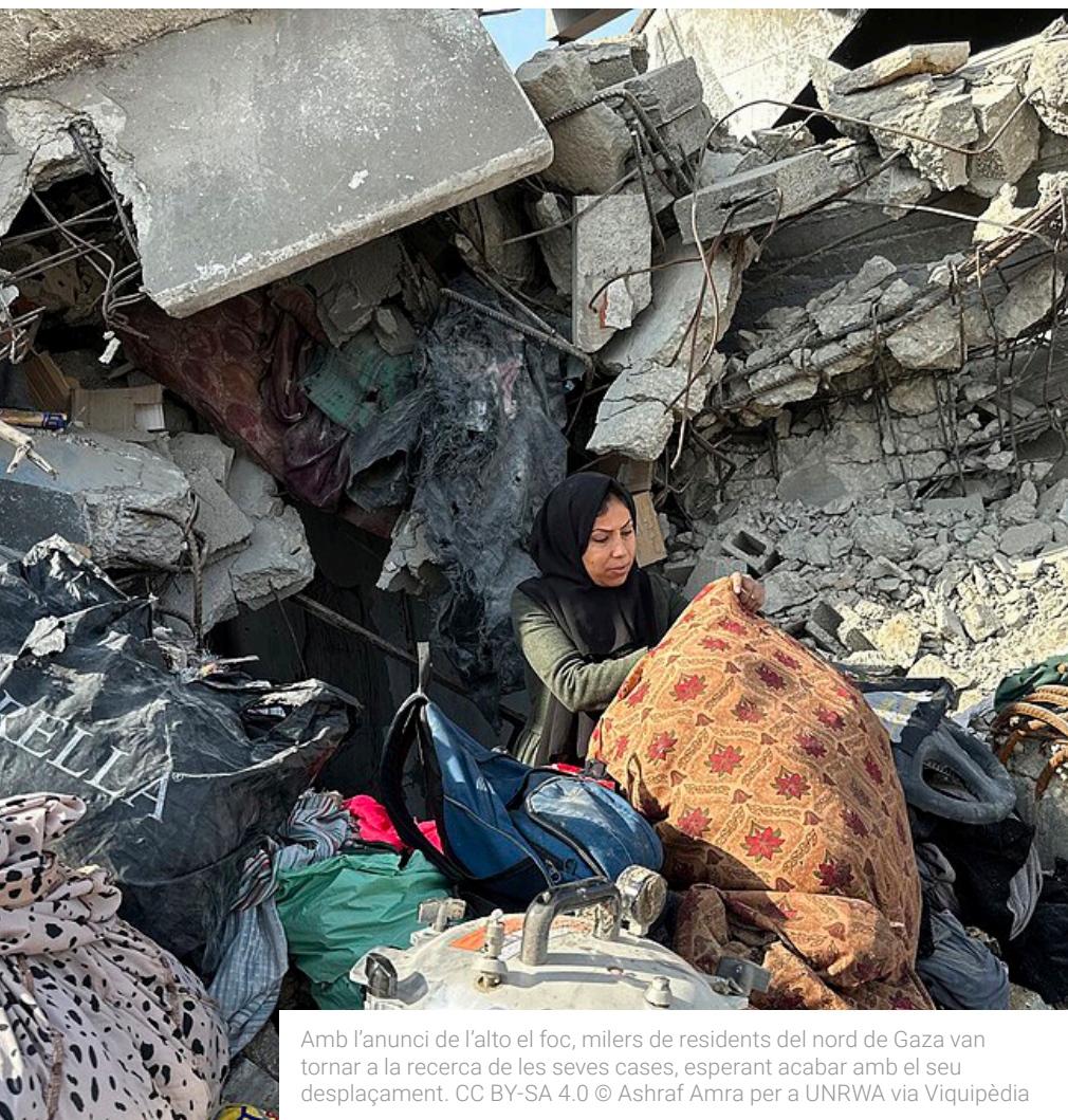
Amb l'anunci de l'alto el foc, milers de residents del nord de Gaza van tornar a la recerca de les seves cases, esperant acabar amb el seu desplaçament.

Això posa en qüestió la implementació de la segona fase del pla de Trump on la qüestió central és si *Hamàs mantindrà el control sobre Gaza, i si serà desarmat. És per això que representants del govern dels EUA estan parlant d'accelerar els esforços per a establir una força d'intervenció internacional i fins i tot buscant legitimitat en fòrums internacionals per a l'acció d'aquesta força.