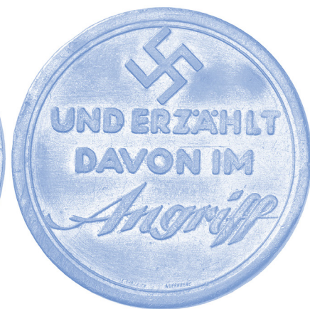
Medalla commemorativa de l'Acord de Ha'ava, signat entre l'Alemanya nazi i els jueus alemanys sionistes, signat el 25 d'agost de 1933, en el qual s'acordava la migració d'aproximadament 60.000 jueus alemanys a Palestina entre 1933 i 1939.

la sang freda del silenci amb què mireu". Cap dirigent sionista va fer costat al rabí. Cap govern aliat va bombardejar.